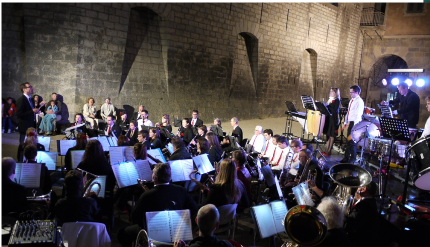
Site historique du Fort l'Ecluse (France)